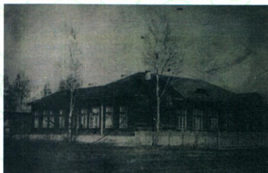
Одно из первых зданий школы