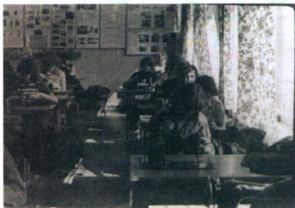
В швейной мастерской