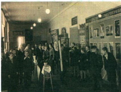
В коридоре школы