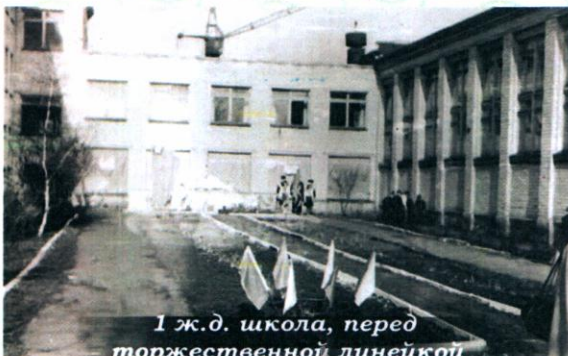
1 ж.д. школа, перед торжественной линейкой