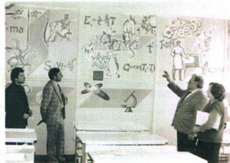
В кабинете физики