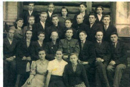
Выпуск 1947 года