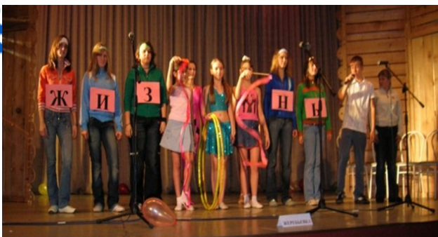
Волонтерский отряд «Жизнь»

Жизнь одна – другой не будет, Радуйся! Живи! И все вредные привычки, От себя гони!