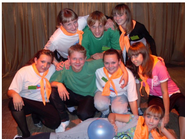
Волонтерский отряд «Жизнь» 2011-2012 год, количество участников -21