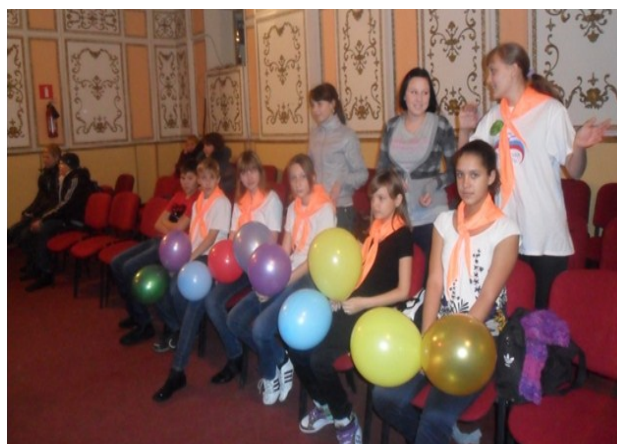
Волонтерский отряд «Жизнь» 2010-2011 год, количество участников -15