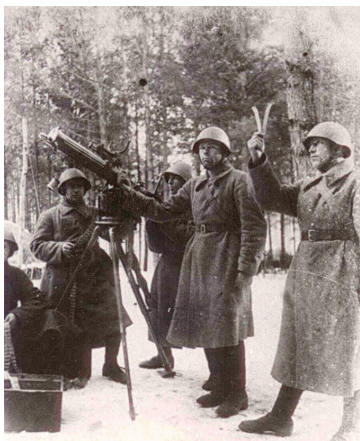
Боевая подготовка 384 стрелковой дивизии, сформированной в Ишиме в 1941 г

«Там, где действовали сибиряки, я всегда был уверен в том, что они с честью и боевой доблестью выполняют возложенную на них задачу.»