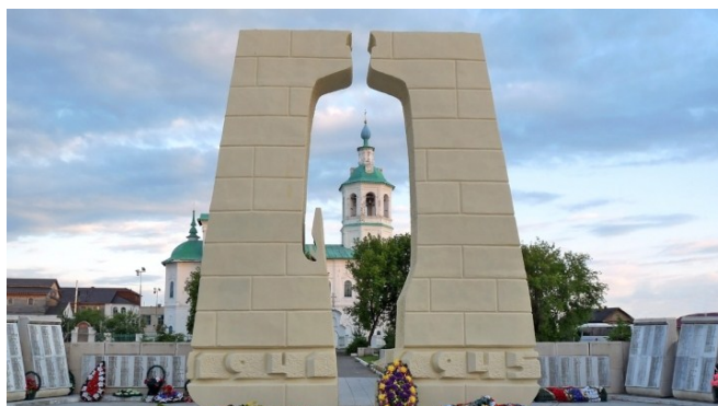
Мемориал войнам Ишима, погибшим в годы Великой Отечественной войны

с двух сторон полукругом мемориальные доски со списками бойцов, не вернувшихся домой. Здесь же стоят самый настоящий танк и пушка, как бы защищая мемориал от непрошенных гостей. Память о воинах, отдавших жизнь за нас и наше будущее, будет в наших сердцах, пока они будут биться. И мы расскажем о них своим детям и внукам. С каждым годом все больше и больше людей становится в строй памяти, Дети идут рядом со взрослыми, отдавая дань памяти.