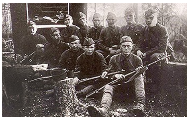
Группа комсомольцев-отличников разведроты 384-й стрелковой дивизии

Еще одна «молодая» дивизия, сформированная в Тюмени и Ишиме из призывной молодежи 1923–1924 годов рождения — 175-я (второе формирование) стрелковая, воевавшая в составе 28-й армии Юго-Западного фронта — попала в окружение под Харьковом. Бойцы и командиры погибли, или оказались в плену.