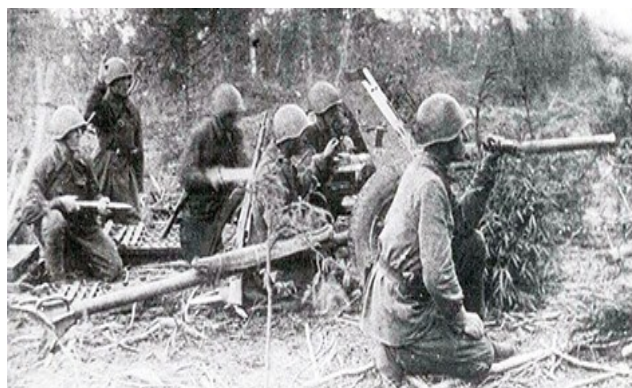
Боевая подготовка 384-й стрелковой дивизии

На Северо-Западном фронте у города Старая Русса в составе 11-й армии вела тяжелые оборонительные бои еще одна «ишимская» дивизия — 384-я стрелковая.