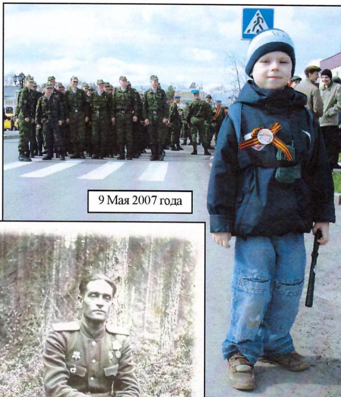
9 Мая 2007 года

Меня поразила история прадедушки о голоде. Дедушка воевал на Ленинградском фронте, позади них были непроходимые болота, а впереди немцы, то есть они были окружены. Бойцам давали тридцать пять граммов сухарей и сто граммов конины, но мясо давали не каждый день. Дедушка в это время был помощником командира полка, ему приходилось жертвовать своими конями, так как люди голодали. Дивизия, где служил мой прадед –