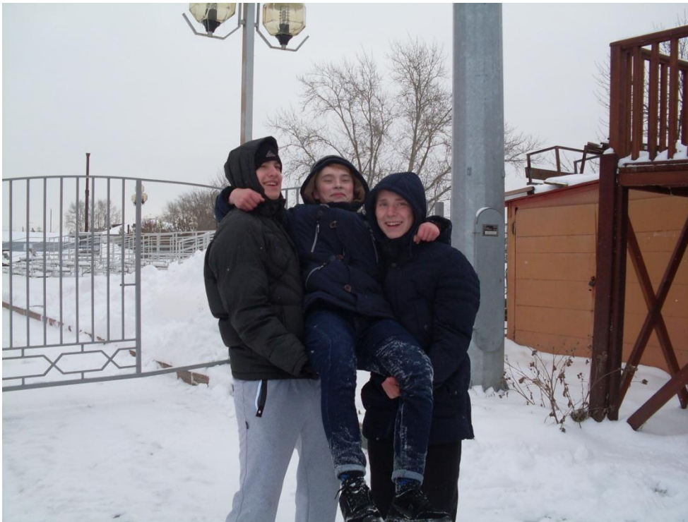
11бв - дышали свежим воздухом, играли в волейбол