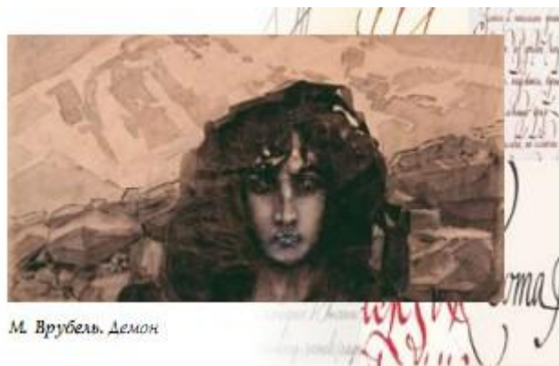
М. Врубель. Демон

Художник ищет присущий каждому из авторов стиль и соответственно этому выбирает графическую манеру. Так, М. Врубель создал образ Демона, близкий по духу трагической и мятежной поэзии М. Лермонтова .