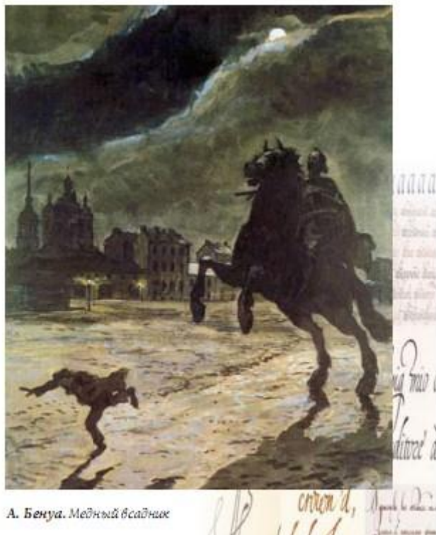
А. Бенуа. Медный всадник

Создание иллюстраций к художественному произведению — дело сложное и деликатное. Художнику-иллюстратору недостаточно владеть материалом, техникой и художественными приемами, недостаточно знать эпоху и ее материальную культуру , необходима особая интуиция, умение почувствовать подтекст произведения в духовном единении с автором. Только в этом случае возникает феномен слияния изобразительного и литературного образа. Неразрывная его целостность и остается в сознании читателя.