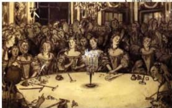
А. Бенуа. Пиковая дама

В иллюстрациях А. Бенуа к произведениям А. Пушкина объединились большая эрудиция и безупречный вкус. Рисунки Бенуа к «Пиковой даме», «Медному всаднику», «Капитанской дочке» — явление высокой художественной культуры.